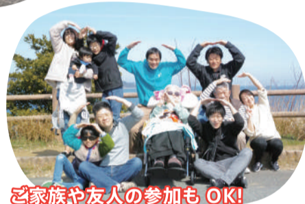
ご家族や友人の参加もOK!