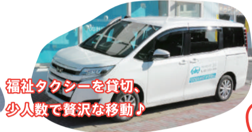
福祉タクシーを貸切、少人数で贅沢な移動♪