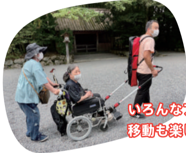
いろいろなアイテムで移動も楽しめます♪