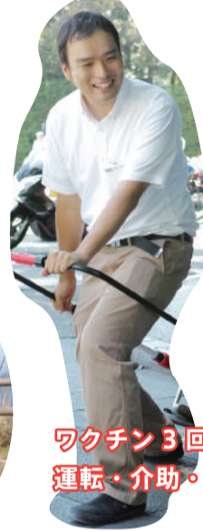
ワクチン3回接種済み! 運転・介助・ガイドはお任せ!