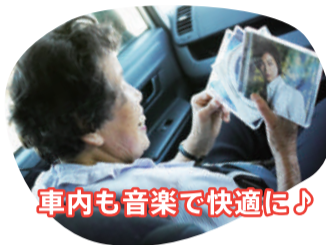
車内も音楽で快適に♪