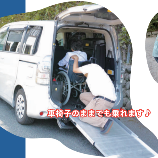
● 車椅子のままでも乗れます♪