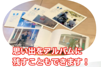
思い出をアルバムに残すこともできます!